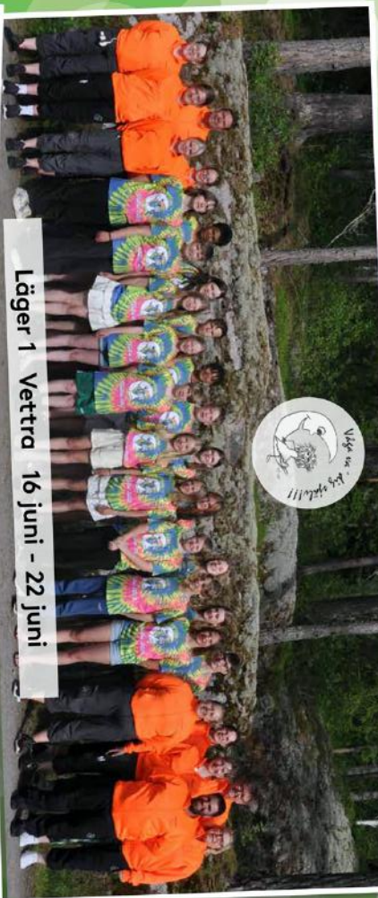
Läger 1 Vettera 16 juni - 22 juni