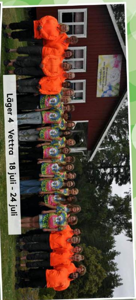
Läger 4 Vettera 18 juli - 24 juli