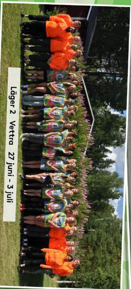
Läger 2 Vettera 27 juni - 3 juli