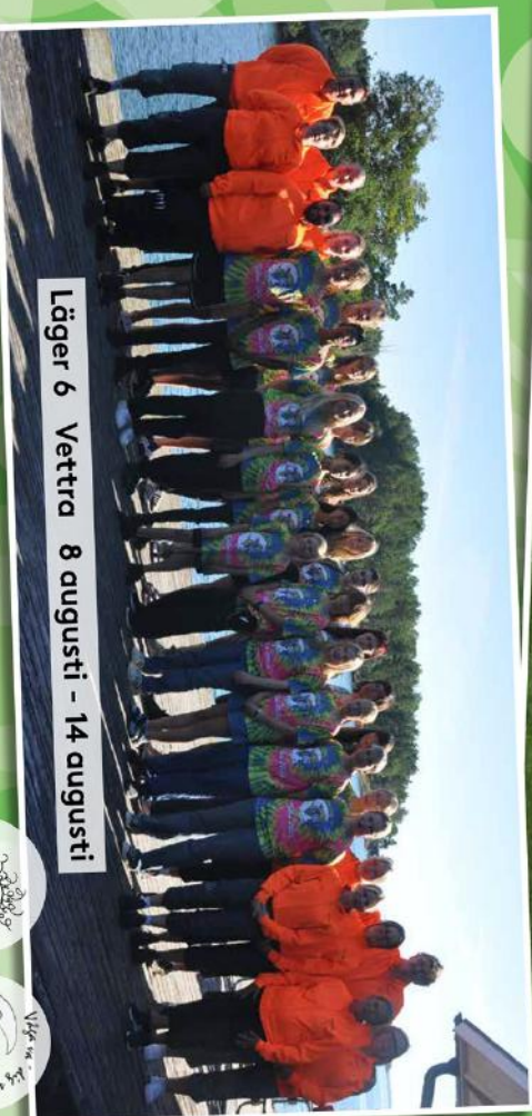
Läger 6 Vettera 8 augusti - 14 augusti