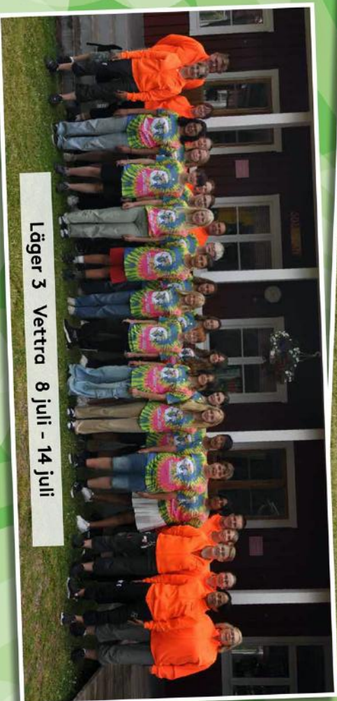
Läger 3 Vettera 8 juli - 14 juli