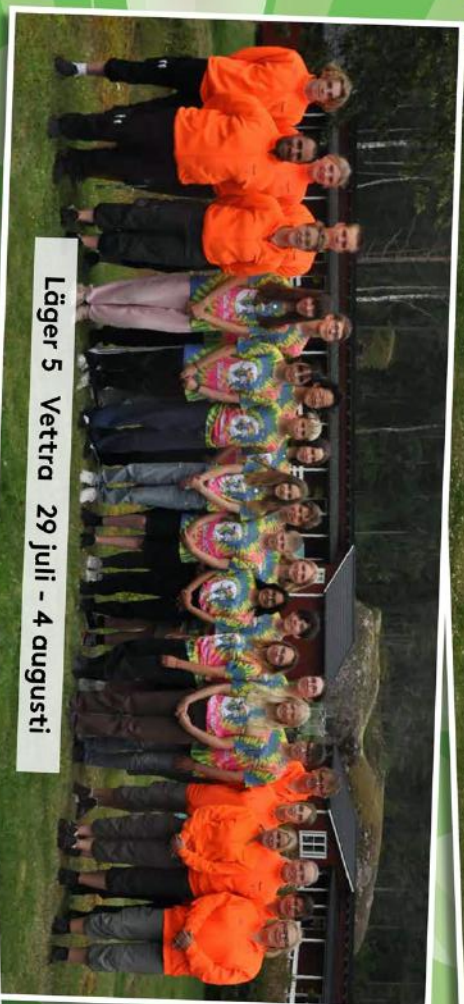
Läger 5 Vettera 29 juli - 4 augusti